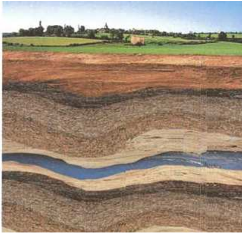
Un aquifère à étudier ?