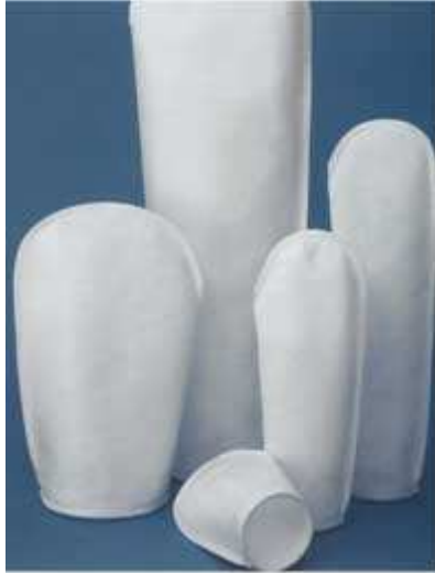
Différentes formes de poches filtrantes