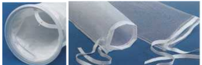
Anneau inox, anneau polypropylène ou sans anneau